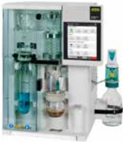
ケルダール蒸留器 K-375 蒸留・滴定、計算までも自動で実施