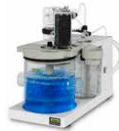
スクラバー K-415 硫酸ガスを安全に中和 (冷却、中和、吸着の3段階構え)