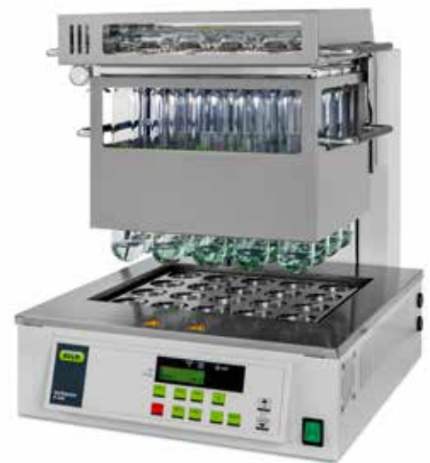
アルミブロック型分解器